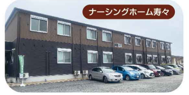
ナーシングホーム寿々