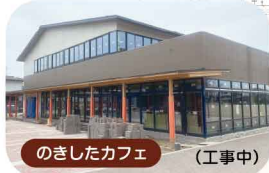
のきしたカフェ (工事中)

のきしたカフェ ジョブズ Shop みんなのたまりば tutti ブックロッシング 就労支援クッキングジョブズ 就労移行クライミング 居宅ケアプレイス プライマリーすてっぷ