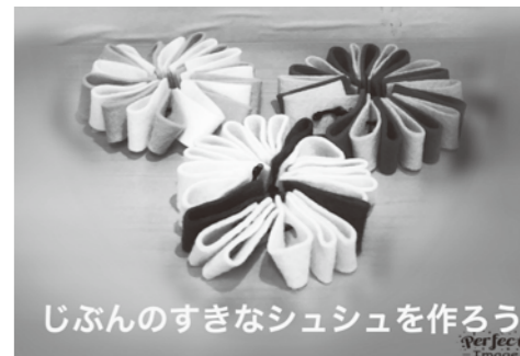
じぶんのすきなシュシュを作ろう