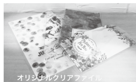
オリジナルクリアファイル