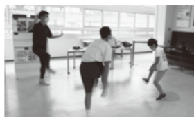
みんなで動画を見た後、思い思いに体を動かします。

《週間プログラム》 月曜日：体育学習・・・上記ご参照ください。 火曜日：基礎学習・・・読み書き計算の学習。各自のペースで進めます。 水曜日：ものづくり学習・・・工作などの組み立てや道具を使う練習もします。 木曜日：創作学習・・・想像を働かせてつくる活動です。 金曜日：総合学習・・・自分を鍛え自分の力で伸びる力を養います。 土曜日(第2・4)：体育学習