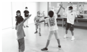
6月の体育学習の様子。月間テーマは「ダンス」です。

「すてっぷ」では、『心と身体を育てる』を今年度の方針の一つとして活動しています。そのため、曜日ごとに「創作学習」や「基礎学習」など目的に沿ったプログラムを設定しています。その中で、月曜日は体育学習を設定しています。体幹を鍛えることを主な目標とし、粘り強い身体を作り、身体の動かし方を学んでいきます。一カ月ごとに「体操」「球技」などテーマを決めて進めています。 ここに通う子どもたちは、年齢に幅があり、体力にも差があります。しかし、どんな子どもたちでも前向きに取り組めるように、みんなで楽しめる全体向けのプログラムと個々人の課題に合わせた個別のプログラムとを組み合わせています。