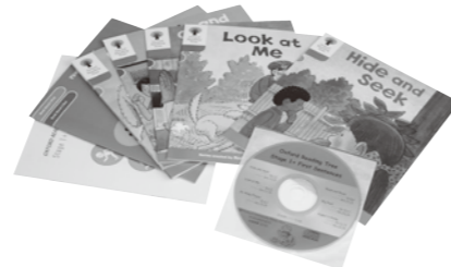
イメージ写真 蔵書はレベル1,3,4

1冊1冊の本は薄く、レベルが上がるごとに単語数が増え、お話も長くなりますので自然にレベルアップでき、大人の方でも夢中になれるかも！？お気軽に洋書コーナーにお立ち寄りください。