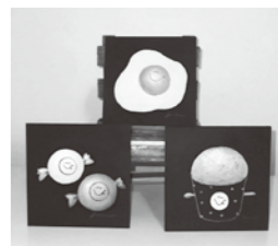
立てても飾れるミニ黒板。裏にマグネットもついています。