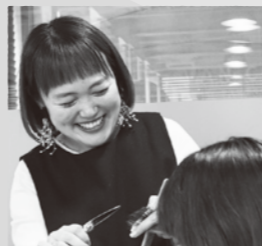
美奈さんのまわりには笑いがいっぱい