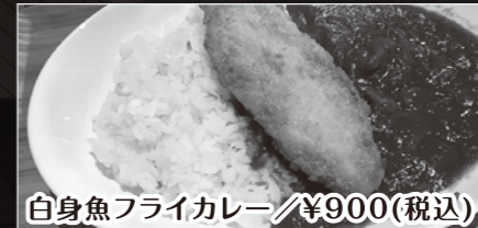
自身魚フライカレー/¥900(税込)

その他、カツカレー/¥950(税込)、ポーク野菜カレー/¥800(税込) ★単品のピザ・パスタもあり。★土日祝もモーニングあり。ハーフピццаア550円、パンモーニングが420円 ★平日・土日祝日のランチタイムのお食事には、プラス100円でランチドリンクが選べます。