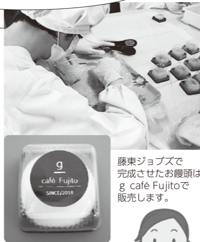
藤東ジョブズで完成させたお饅頭は、g café Fujitoで販売します。

※現在、「高蔵寺和っか饅頭」は予約販売のみとなっています。予約は随時受付中です。お盆の手土産にいかがですか? 其他のお饅頭は毎日販売しています。