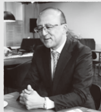
のびやかなミドルトーンボイスが魅力の歌う司法書士

もともと音楽好き。ピアノ音楽教室の発表会の運営も手伝っています。「サクラミュージックサロン音楽イベント部」を立ち上げ、各ホールや老人施設などで音楽会を主催しています。子ども達や保護者の方々からは「社長さん」と呼ばれ親しまれています。「子どもから高齢者まで気軽に音楽に親しめる環境を作りたいです。自分自身、辛い時は音楽に救われたりしますからね」。