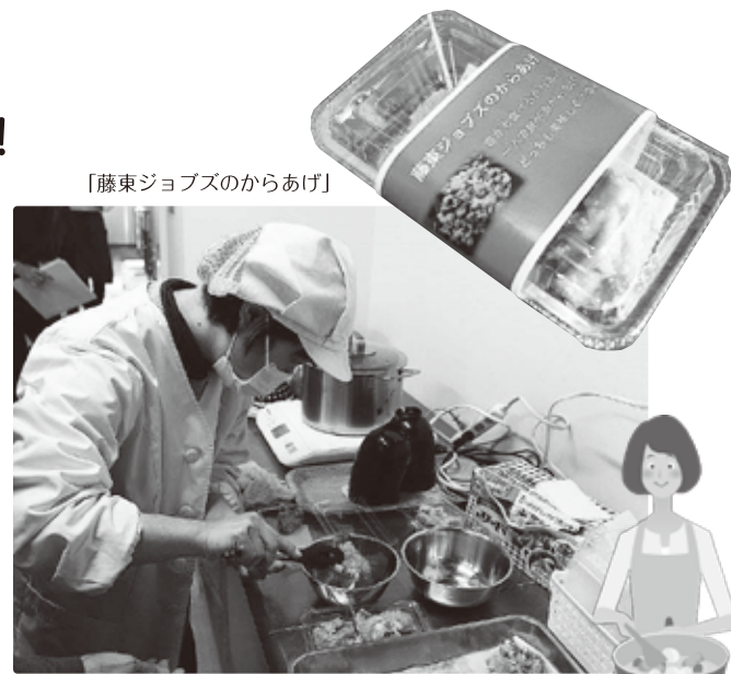
「藤東ジョブズのからあげ」

「藤東ジョブズのからあげ」。たかがから揚げと思うなかれ! お肉は柔らか。企業秘密の製法でおいしさを閉じ込めています! 肉の切り出しから味付け、秘密の工程を経て油で揚げます。すべて手作り。ジョブズの皆さんが丁寧に作るので、大量生産ができません。売り切れていたらごめんなさい。この「からあげ」はジョブズの自慢。一度ご賞味ください。*予約も受け付けています。