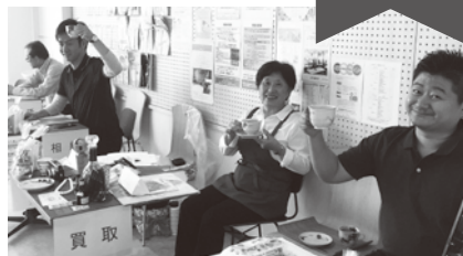
身の回り品の片づけ・買い取り、福祉関係の相談もありました。

— どのような相談内容がありましたか? 「親の不動産を兄弟で共有しているが今からやっておくことは何か。親が亡くなったが相続はどうなるか。ほか保険の解約、確定申告のことなどです」。 — どのようなアドバイスをされましたか? 「お一人お一人で違うのでお話をじっくり聞かせてもらい、それにあうアドバイスをさせていただきました。おかげで、わかりやすかったとか、親身に相談してもらえたと感想をいただきました」。